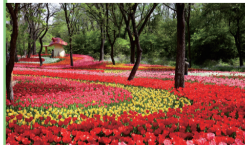
百花斗艳俏，沈阳植物园主题春花展，每一种都美到爆。

园区全新开放“古堡探险梦工厂”无动力项目。依托南区欧式建筑群落，设置14.5米高的攀岩和“窝囊废”蹦极、230米