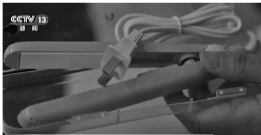
迷你电熨斗。

执法人员在某商贸中心一家儿童玩具批发零售门店检查时发现，店内货架上堆放多款无厂名厂址、无3C认证的拼豆玩具，且标注适用年龄为3岁以上。面对检查，店主辩称相关产品为“自家小孩自用，非卖品”。