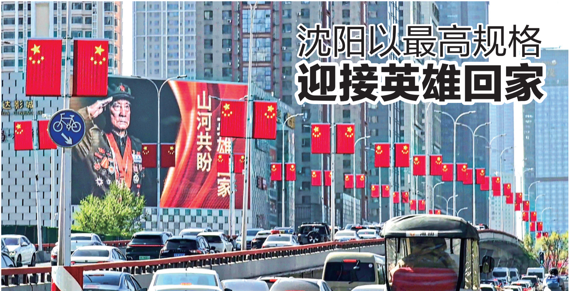
为迎接第十三批在韩中国人民志愿军烈士遗骸回国,沈阳市以最高标准、最严要求全面落实市容环境保障工作。