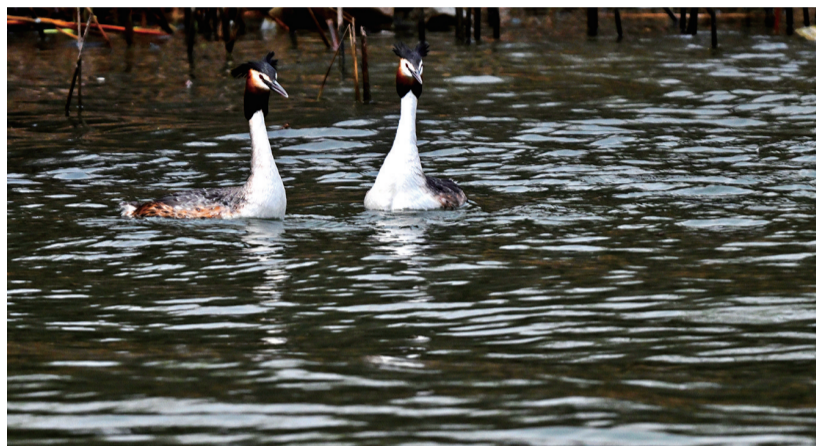
丁香湖畔的贵客，它们就是国家二级保护野生动物——凤头鸊鷉。