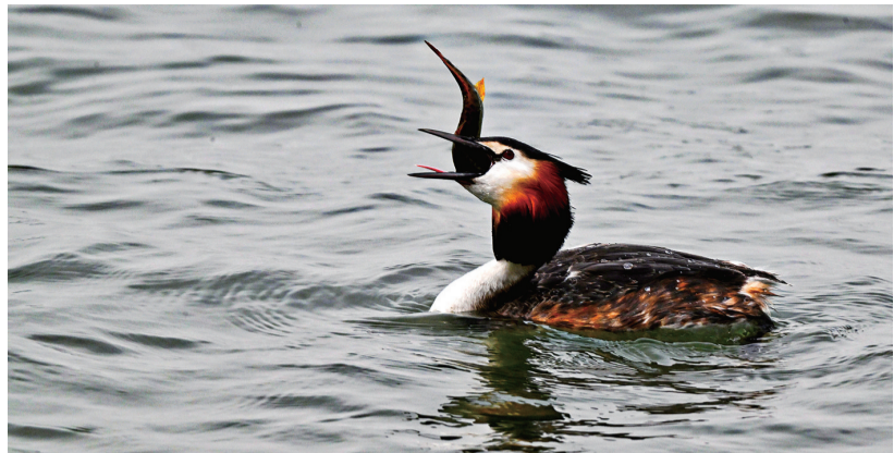
凤头鸊鷉在这里进食，丁香湖鱼类资源丰富，三餐不愁。