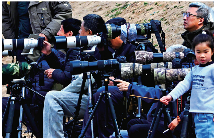
摄影爱好者来到丁香湖，用镜头记录下珍稀鸟类的身影。