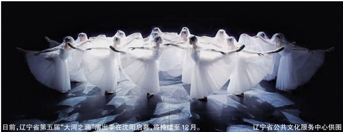
日前,辽宁省第五届“大河之澜”演出季在沈阳启幕,将持续至12月。