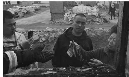
清点找到的现金。

本报讯 记者张宇报道 4月5日,庄河市兰店乡磨石房村一处厦子突发火灾,新华路消防救援站火速到场处置。灭火过程中,受灾户主心急如焚地赶到现场,神色慌张地向救援人员说明,厦子内存放着一笔现金,尚未取出。