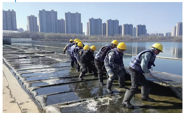
工作人员对橡胶坝进行检修。

“这些高架桥、地道桥和地下通道,是城市交通的‘主动脉’和‘微循环’。我们抓住春季回暖的有利时机,通过集中水洗、人工清洗与智能设备清洗相结合的方式,让市政设施见本色、展新颜。”市城管执法局相关负责人表示。这场春季“梳洗”,既是城市管理的“常规动作”,更是城市精细化治理理念的“生动注脚”。