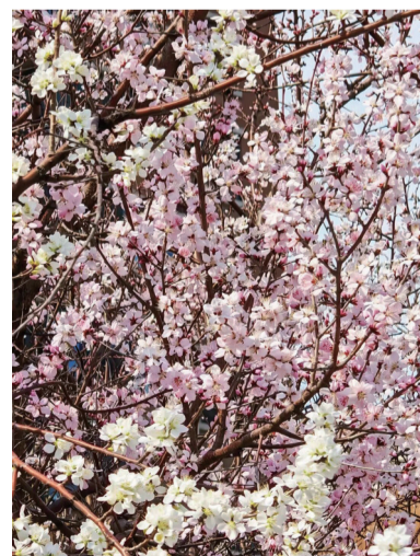
真的很喜欢,春天来了,心情都美美的。 @AI~小爱同学