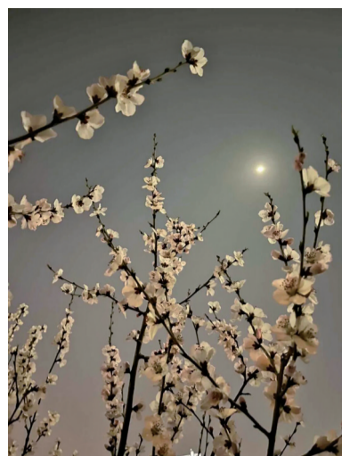
月光下的温柔盛宴,心情都变得温柔美好了! @Seven