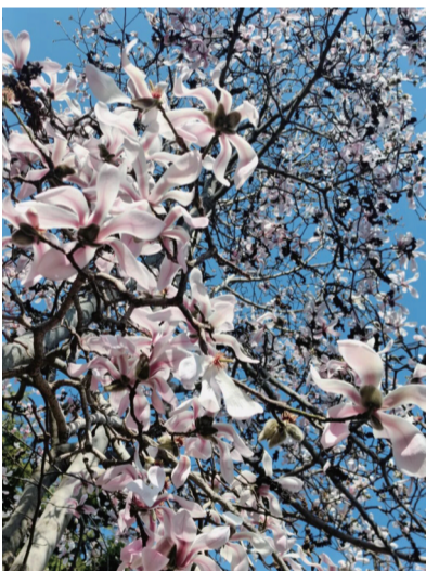
劳动公园玉兰花。 @应逃完 紫