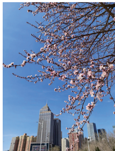
马年春天拍到的沈阳第一朵春花,让人心情舒畅。 @wenchang.yin