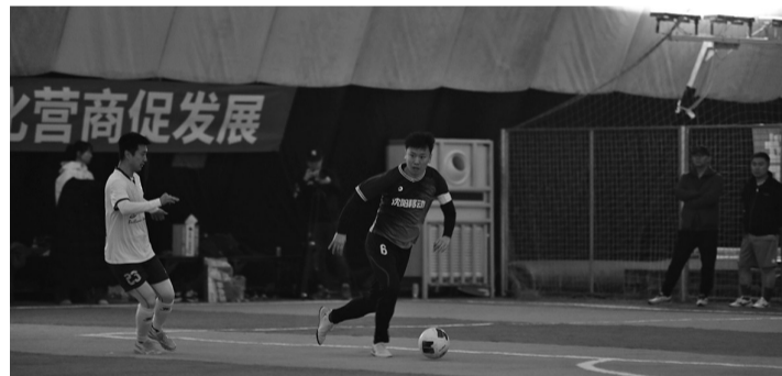
近日，“东北超”沈阳—欧盟经济开发区企业选拔赛在喜园文化产业园·连理体育运动中心圆满落下帷幕。

本次选拔赛获奖的优秀球员将被推荐代表沈阳市参加“东北超”正式比赛，全力冲击更好的成绩。