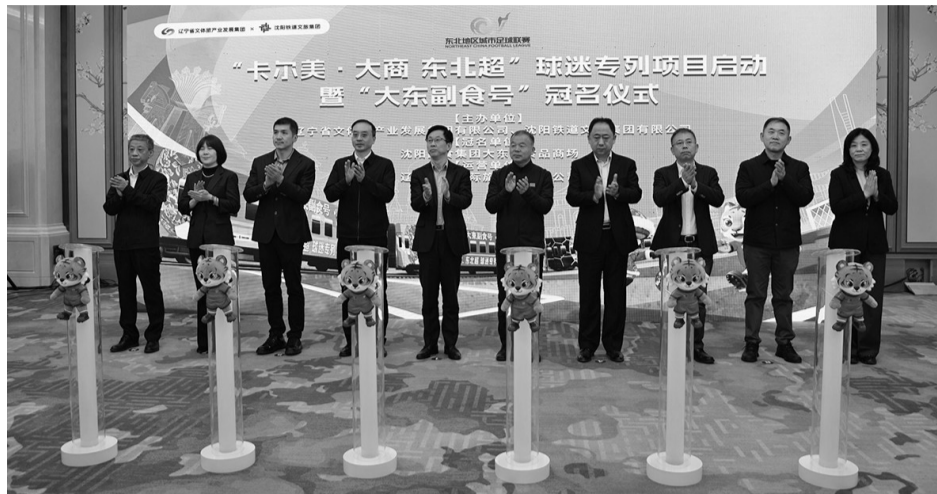
“东北超”球迷专列项目正式启动。