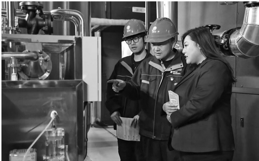
国网本溪供电公司精准对接生物医药产业的每一个用电需求。

在成大生物(本溪)有限公司的生产车间里，微生物培养需要恒温恒湿的精密环境，冷机、空调等设备一刻不能停歇。当企