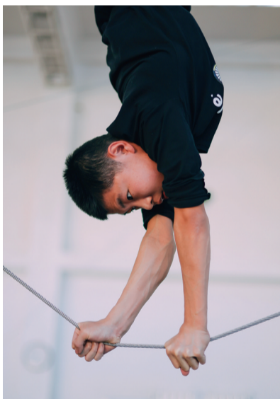
犹如定海神针在钢丝上一动不动。