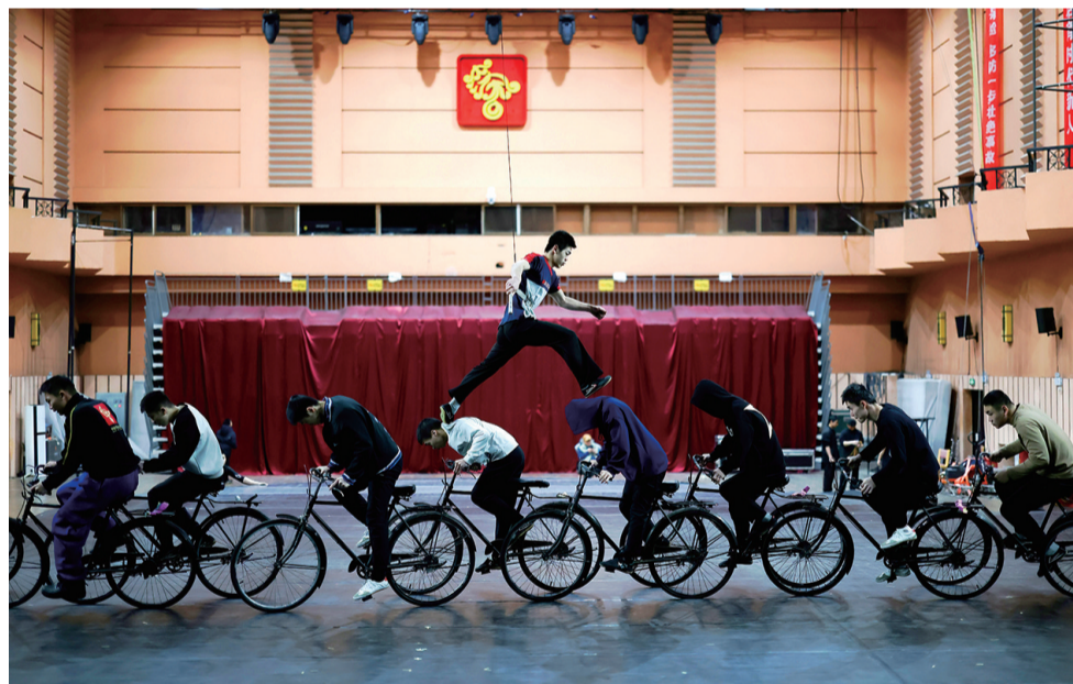
▲他们用日复一日的汗水,续写着沈阳杂技的辉煌。