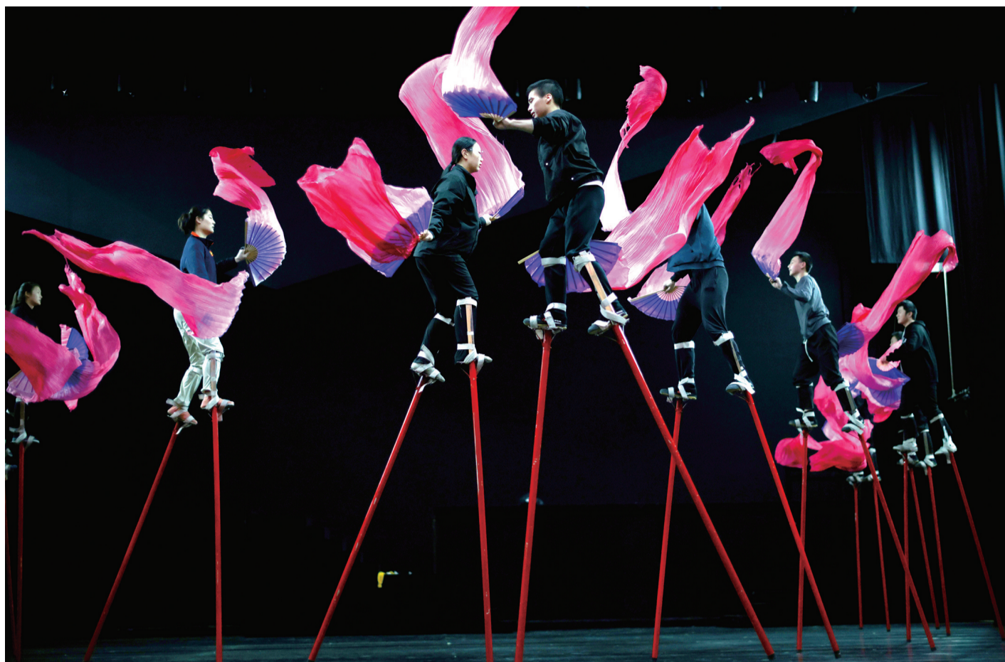
幕后的汗水与坚守,为了每一个动作协调一致,日常训练一丝不苟。