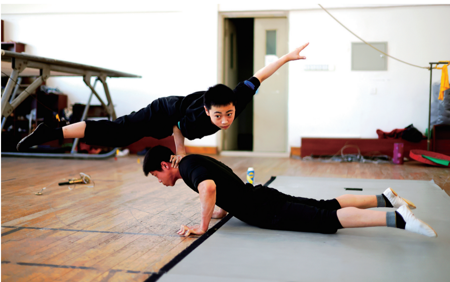
经年累月的刻苦训练,不仅打磨出精湛技艺,更淬炼出坚韧不拔的品格。