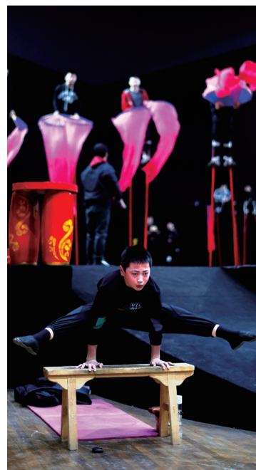
荣耀的背后,是一代代杂技人的坚守与传承。