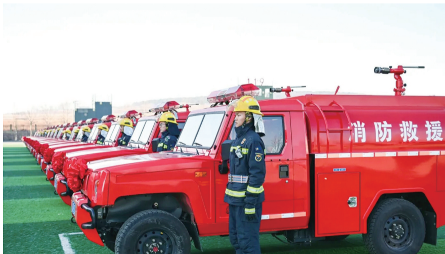
151辆消防“新装备”集中配发。