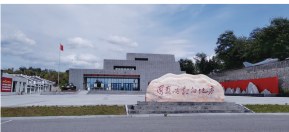
东北抗日义勇军纪念馆。

2005年,桓仁在全国率先论证并提出桓仁是“国歌原创素材地”的城市品牌,出版了研究成果《国歌原创素材地》一书;2014年6月,时任中共党史研究会常务副会长、中央党史研究室原副主任谷安林率团来桓仁调研,对桓仁是国歌原创素材地给予充分认可;2015年,桓仁与央视电影频道合作,以桓仁为素材拍摄地联合摄制电影《义勇军魂》,扩大桓仁国歌原创素材地影响力;2016年,桓仁通过辽宁省委向中央提出申请建设东北抗日义勇军纪念馆的请示。经中央办公厅和国务院办公厅批准,纪念馆2018年9月建成开放,填补了国内没有集中展示义勇军抗战史实场馆的空白;2021年,东北抗日义勇军纪念馆成为