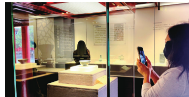
9月29日，“一色千秋——沈阳故宫颜色釉瓷器展”在沈阳故宫博物院开展。

本报讯 记者朱柏玲报道 瓷器是中华文明的重要名片，琳琅釉色则让这火与土的结晶熠熠生辉。