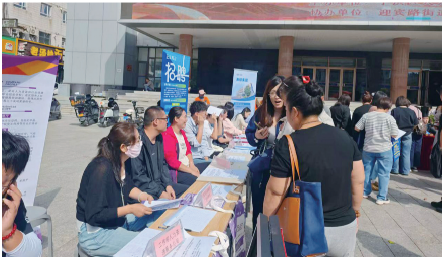
于洪区举办外贸企业专场招聘就业大集活动。

本报讯 记者朱柏玲报道 9月17日，沈阳市于洪区人社局举办“金秋聚力 同心护航”——“‘岗’好有我，‘职’等你来”外贸企业专场招聘就业大集活动。本次活动共吸引近40家优质外贸及涉外服务企业参与，涵盖跨境电商、制造业、物流、服务业等多个领域，累计提供就业岗位376个。活动现场人气高涨，求职者络绎不绝，接待咨询近600人次，初步达成就业意向超百人。据悉，为提升招聘影响力与便捷性，本次活动采用“线上直播带岗+线下现场对接”双轮驱动模式。有效拓展了服务半径，提升了公共就业服务的可及性与智能化水平。活动结束后，区人社局第一时间启动企业满意度回访机制，便于后续进一步优化活动形式。