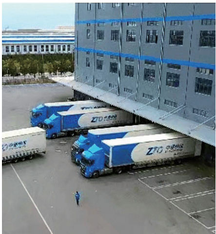
盘锦快递业务量增速位居全省前列。

上半年,邮政行业业务收入累计完成8.13亿元,同比增长7.52%。其中,快递业务收入累计完成6.57亿元,同比增长10.46%。上半年,邮政行业寄递业务量累