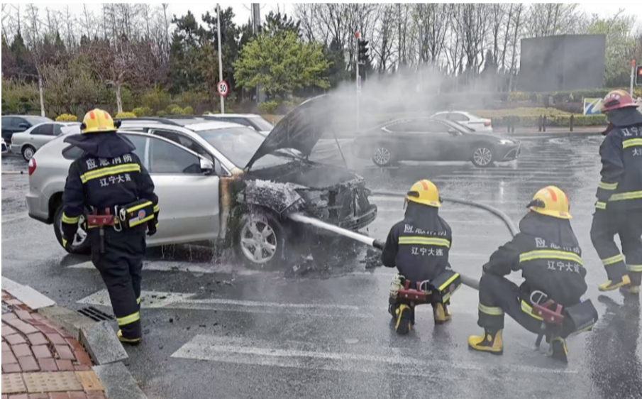
4月27日8时27分，大连市甘井子区明珠路与张前路交叉口附近一辆轿车突然起火。甘井子区消防救援大队张前路消防救援站接警后，成功扑灭火情。

车主出行要注意行车安全。需定期检查电路、油路系统，避免私自改装；随车应配备灭火器，发现异味、冒烟等异常情况时立即停车断电，远离车辆并报警求助。