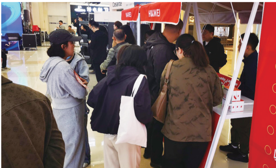
消费者在大集中选购手机。