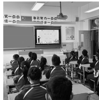
学生们在老师的带领下召开主题班会。

本报讯 记者张帆报道 12月23日至24日,沈阳市铁西区保工街第一小学积极响应国家号召,成功举办了以“扫黄打非·护苗”为主题的班会活动。此次活动旨在提高学生的法律意识、鉴别能力和自我保护意识,营造健康向上的校园文化氛围。