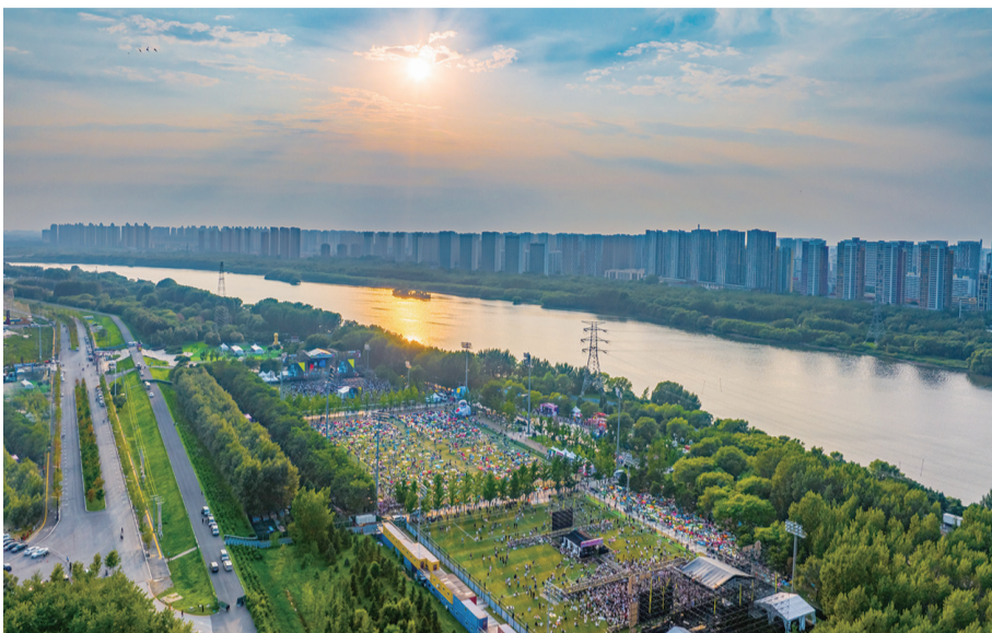
和平区明年加力推进4个核心发展板块建设。

截至目前,新台子派出所已成功为辖区群众及时止付被骗资金80余万元,为百姓追回返还被骗资金30余万元,派出所的此项工作得到了辖区群众的一致好评!