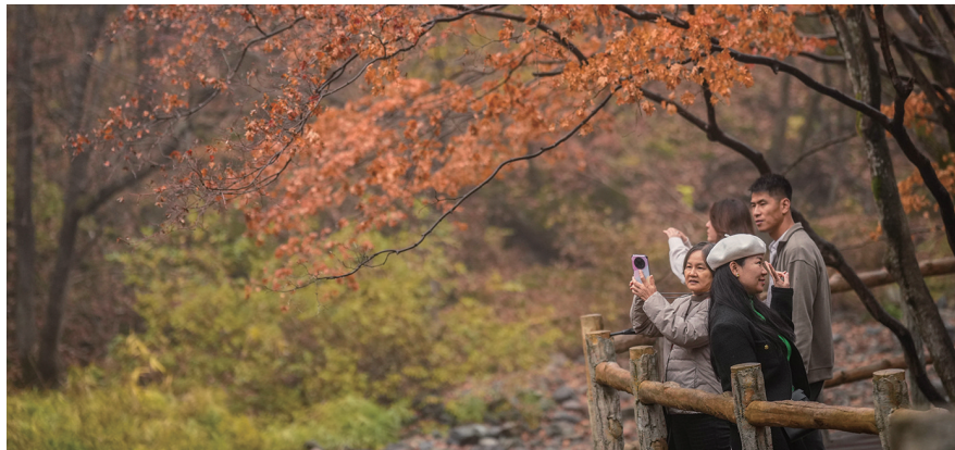
游客在关门山国家森林公园游览拍照。