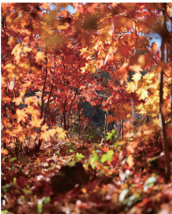
老边沟风景区的金秋景色。