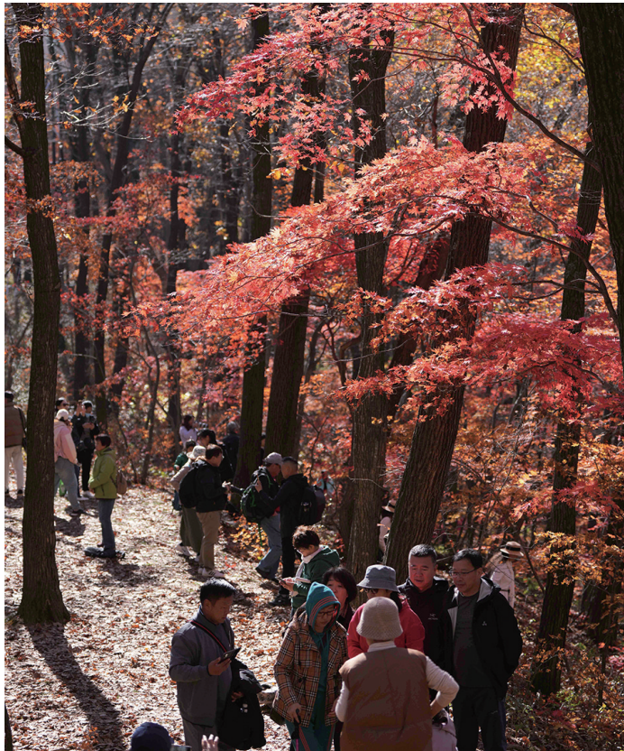
游客在辽宁本溪的老边沟风景区游玩。