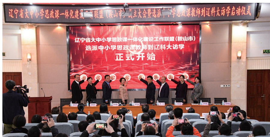
辽宁省大中小学思政课一体化建设工作联盟(鞍山市)成立大会在辽宁科技大学图书馆报告厅举办。

学校党委成立了加强马克思主义学院建设和思政课建设领导小组,印发了《关于加强新时代马克思主义学院建设和思政课建设的实施意见》,实现了思政课教师与辅导员队伍联动融合发展,形成了思政课教师准入和退出制度,优化了思政课评价体系,制定了思政课教师中长期发展规划。马克思主义学院通过推进“资深教师与青年教师‘手拉手’导师责任制”,开展“思政课教师教学学术推进计划”“思政课教学质量建设年”等系列活动,发挥思政教学名师的示范作用,全方位培训思政课教师,坚持教学与研究相结合,着力打造高素质思政课教师队伍。经过几年时间的精准扎实培训,多名思政课教师荣获全国高校网络教育名师、宝钢优秀教师、全国高校形势与政策课教学能手、辽宁省“兴辽英才计划”教学名师、辽宁省本科教学名师等荣誉称号,在全国高校思政课教学展示中,1人获一等奖,3人获二等奖,14人在辽宁省高校思政课教学大赛中获一等奖,1人在辽宁省高校教师教学大赛中获特等奖。