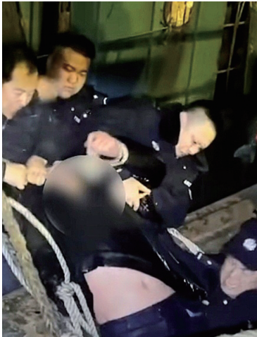
船上的民警合力拉拽,海中的民警托举,落水者成功获救。

“有人落水了,快来帮帮忙!”3月15日零时,在葫芦岛绥中洪洋码头附近海域,一男子酒后失足落水。危急时刻,路过的出租车司机立即报警求助,杨家沿海派出所民警与海岸义工救援队队员齐伸援手,大家合力将男子成功救上岸。