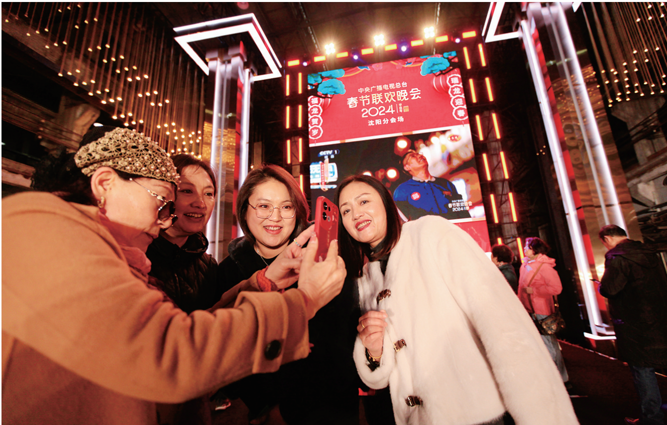
市民参观春晚舞台。