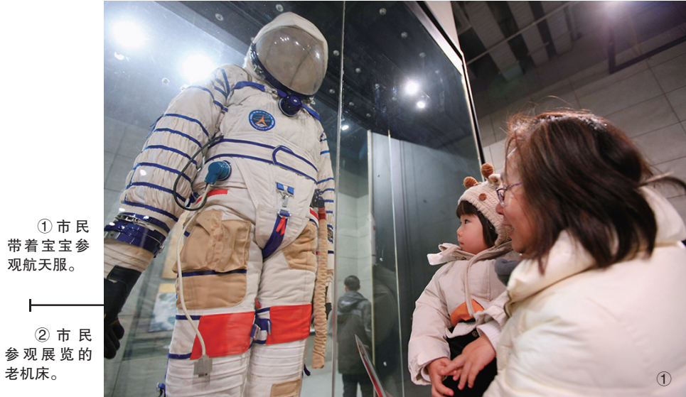
① 市民带着宝宝参观航天服。