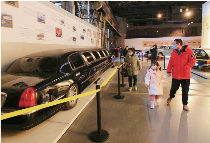
市民带着孩子在汽车馆里参观。