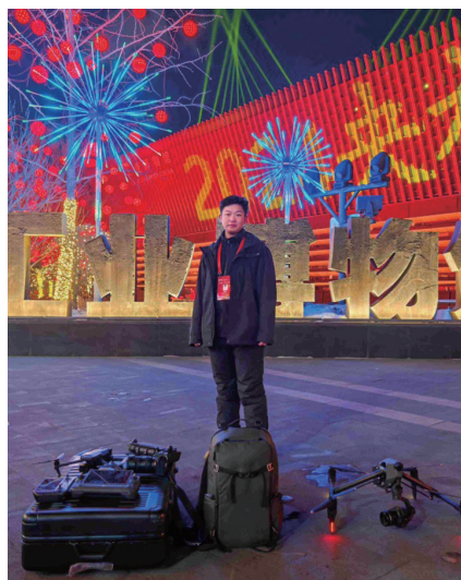
李奥参加央视春晚航拍。