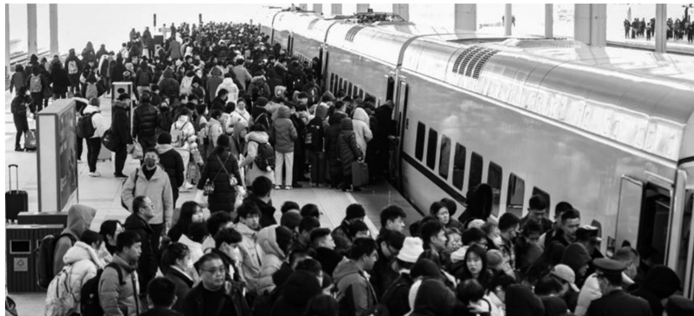
元宵节过后,沈阳各大火车站迎来以务工返城流和学生流为主的第二个返程客流高峰。