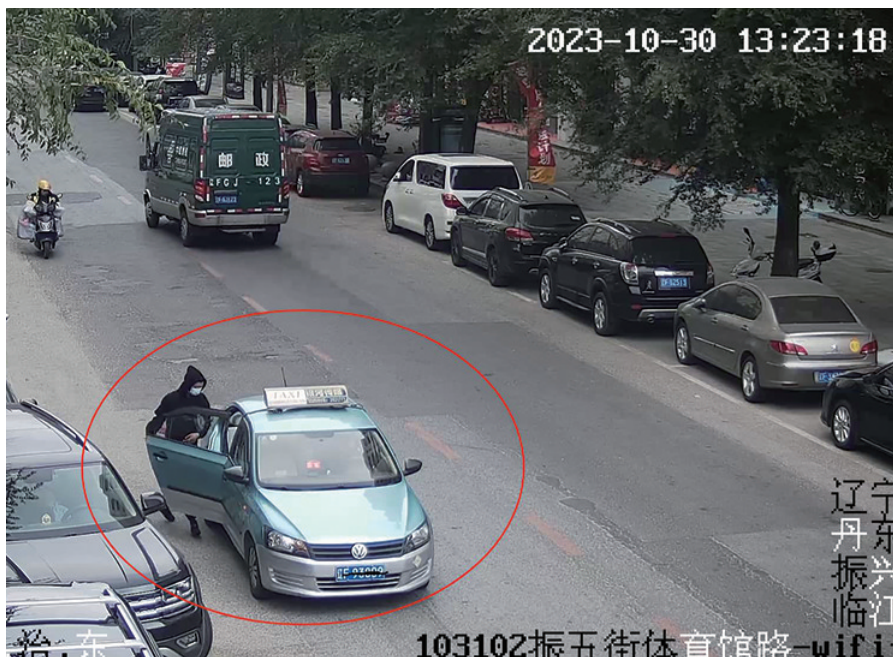
嫌疑人坐出租车逃跑。