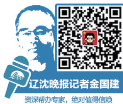
资深帮办专家，绝对值得信赖