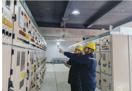
国网辽阳供电公司工作人员对变电站巡检测温,保障迎峰度冬期间设备安全稳定运行。

当前,东北地区持续低温,电力保供迎来考验。辽阳供电公司扛牢电力保供首要责任,超前完成迎峰度冬重点电网工程建设。9月27日,辽阳铎二66千伏变电站改造工程顺利投运,比计划提前2个月竣工。