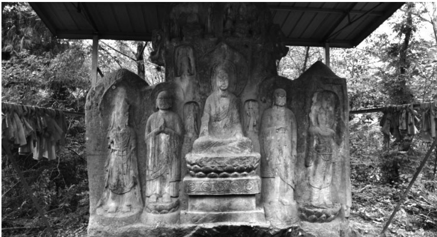
近日，四川南江县一处北魏晚期营造的摩崖造像被涂抹，图为涂抹前。

珍贵石窟佛像被“浓妆艳抹”，近年来，全国各地类似事情时有发生。2018年8月，四川资阳市安岳县封门寺石窟佛像遭遇油漆重绘、水泥修补事件被网友曝光，引起了热议。经四川省文物局现场核查，发现当地有13处文物点确实存在佛像被“妆彩重绘、不当维修”的情况，其