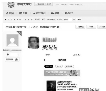
中山大学贴吧网友发文称特困生买1500元演唱会门票。

帖文显示，一名中山大学2021级本科生因“特别困难”获得了一笔助学金，但有网友称这名同学的经济条件并不差，平时用的是苹果电脑、平板、手机等四件套产品，价值2万元，而且还购买了王嘉尔将于11月25日在广州举行的演唱会门票，票价达到1517元。