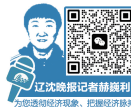
辽沈晚报记者赫巍利 为您透彻经济现象、把握经济脉搏

沈白高铁建成通车后,辽宁省14个地级市将有效串联起来,并通过沈阳、锦州等铁路枢纽