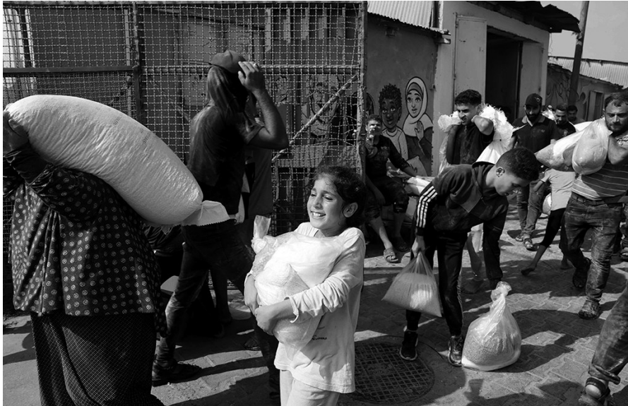
10 月 28 日,在加沙地带的代尔拜拉赫,民众在联合国近东巴勒斯坦难民救济和工程处的一个仓库搬运食品等物资。

联合国近东救济工程处 29 日说,加沙地带数千计民众闯入该机构设在当地的多处仓库和配送中心,抢走面粉及其他基本物资。