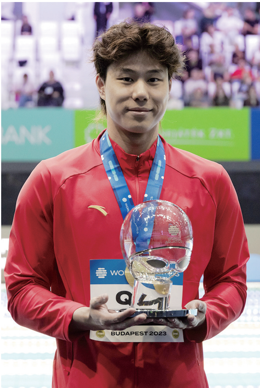
10月22日,覃海洋获得世界泳联世界杯年度总冠军。