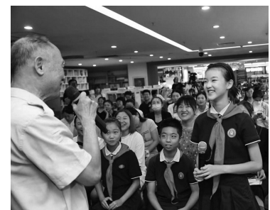
活动现场。

日前,“学习雷锋精神 践行榜样力量”读书分享会举行。邀请辽宁籍著名军旅作家、诗人胡世宗宣讲雷锋精神,分享著作《洪流放歌——我写雷锋60年》的创作过程,与青少年互动。