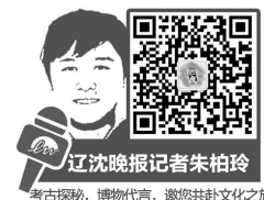
辽沈晚报记者朱柏玲 考古探秘,博物代言,邀您共赴文化之旅