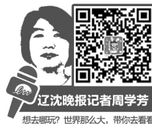
辽沈晚报记者周学芳 想去哪?世界那么大,带你去看看