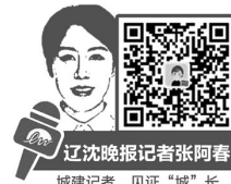
辽沈晚报记者张阿春 城建记者，见证“城”长