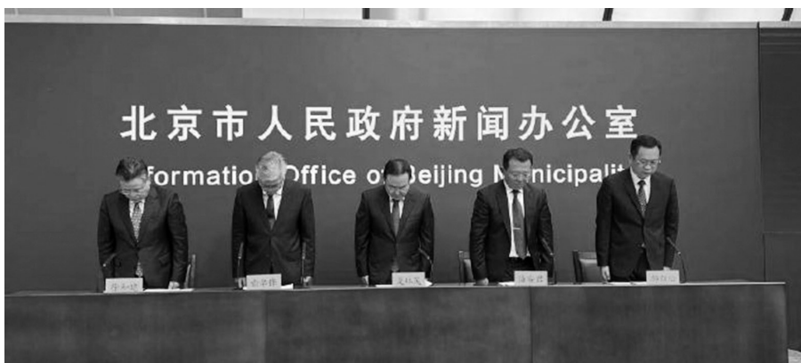
发布会现场,全体人员起立,为遇难人员默哀。

灾情发生后,北京市委市政府一刻不停“抢险、抢修、抢通”,全力做好“四通一保(通路、通电、通讯、通水和受灾群众基本生活保障)”、伤员救治、群众安置等各项救灾工作。一是快速