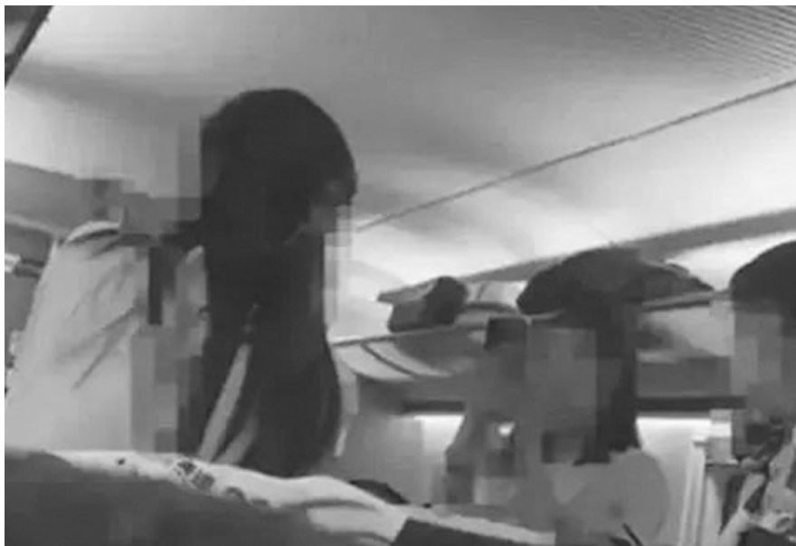
事发现场视频截图。