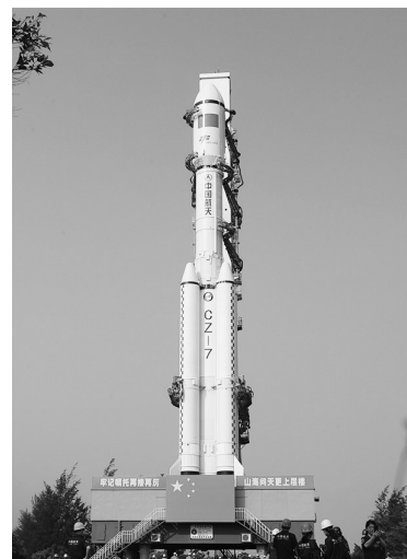
5月7日,天舟六号货运飞船与长征七号遥七运载火箭组合体在垂直转运中。

天舟六号货运飞船任务9日上午组织了发射前系统间全区合练。目前,各系统已经做好发射前准备工作。