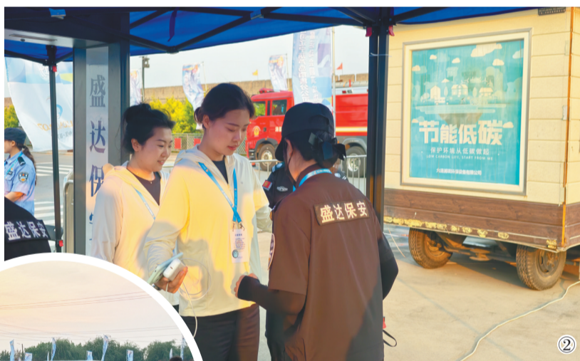
①省“十五运”开幕式现场,小演员争相与吉祥物“福宝”和“虎哥”合影。 ②赛事安保人员对入场观众和嘉宾进行安检。 ③开幕式演出阵容以本地学生为主,小演员们在候场。