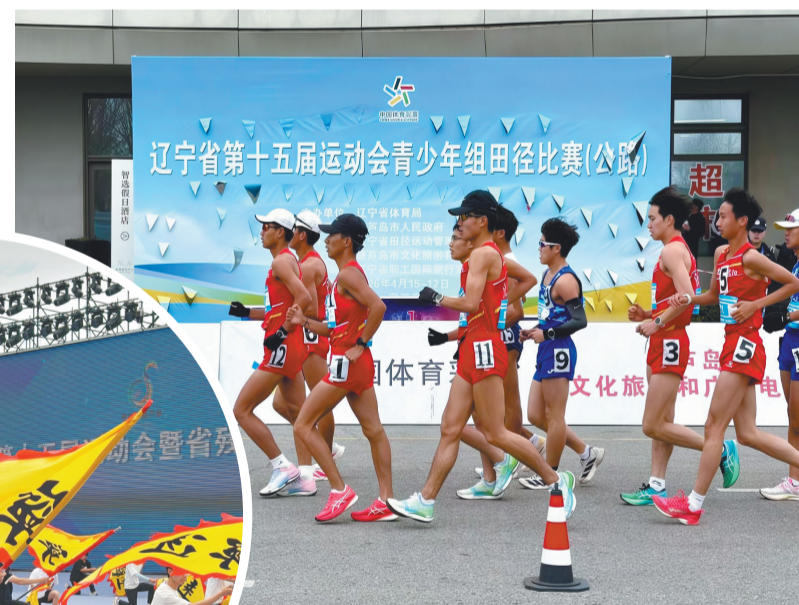
▲省“十五运”青少年组田径比赛。▲辽宁省第十五届运动会暨省残特奥会开幕式彩排现场。