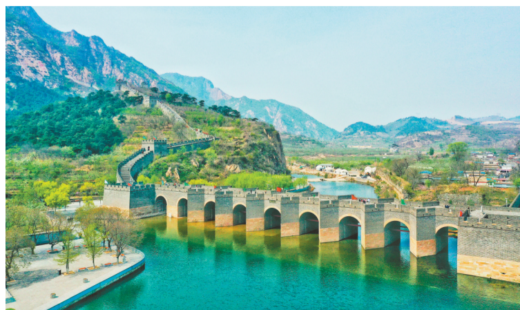
绥中九门口水上长城。