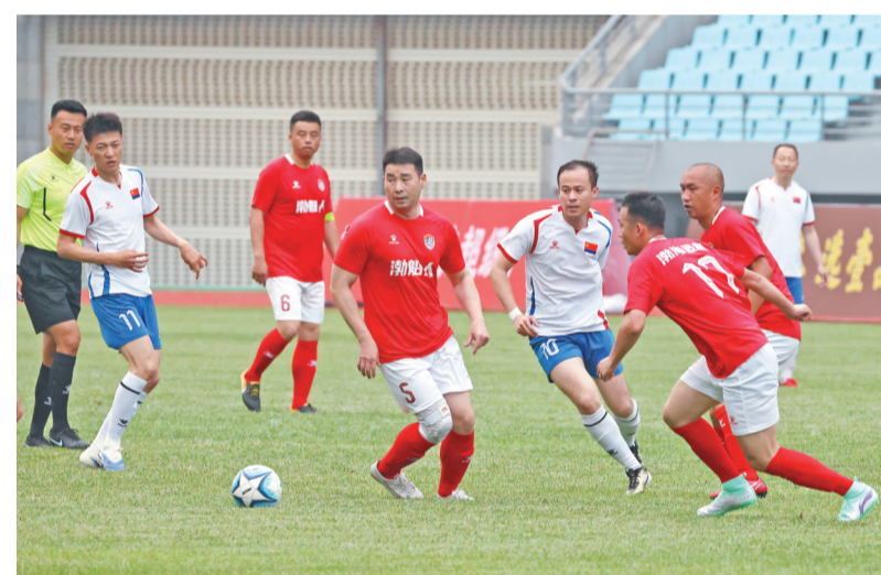
2026年葫芦岛市职工足球超级联赛火热开赛。

眼下，葫芦岛正以崭新的活力形象，敞开怀抱；邀八方来客，以“赛”之名，共赴这场浪漫山海相约，近距离读懂这座城市的山海、人文之美。