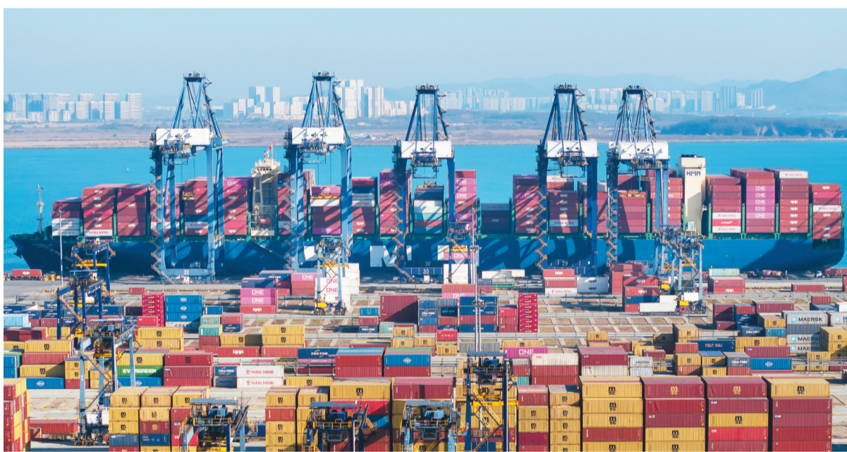
图为大连港集装箱码头一派繁忙景象。

CPPI聚焦船舶在港时间、集装箱吞吐量等关键运营指标,是衡量全球集装箱港口绩效基准、观察和评估供应链压力、综合衡量港口在全球贸易网络中作用的重要参考。作为辽港集团外贸集装箱枢纽港,大连集装箱码头公司着力深化智慧绿色港口建设,持续释放“快速捷”“高精度”两大特色服务品牌效能,连续两年在中远海、马士基等主流航线挂靠港排名中稳居第二,并荣获海洋联盟2025全球港航合作伙伴大会“全球码头效率奖”,6年蝉联金轮杯“用户满意的集装箱码头”称号,服务效率与保障能力持续增强。