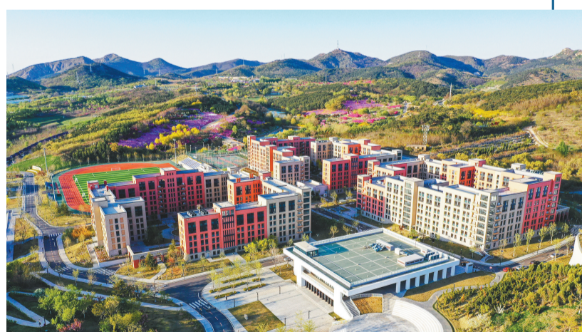
大连英歌石科学城。