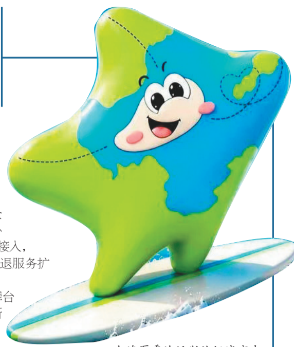
大连夏季达沃斯论坛城市吉祥物“沃星”惊喜登场。

一城锦绣盛景，一场全球盛会。黄渤海之滨，大连万象更新，2026夏季达沃斯论坛正式启幕。大连再度以山海为席、以诚意有礼，敞开怀抱拥抱全球宾朋，共赴一场创新、合作、共赢之约。