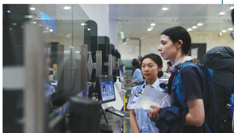
大连周水子出入境边防检查站全面优化入境体验，为中外嘉宾提供更加高效、便捷、暖心的通关服务。

游客纷至沓来。2025年，大连入境游客157.57万人次，增长70.22%，创历史新高，成为高居榜单“宜居宜业宜游的国际滨海旅游目的地”。