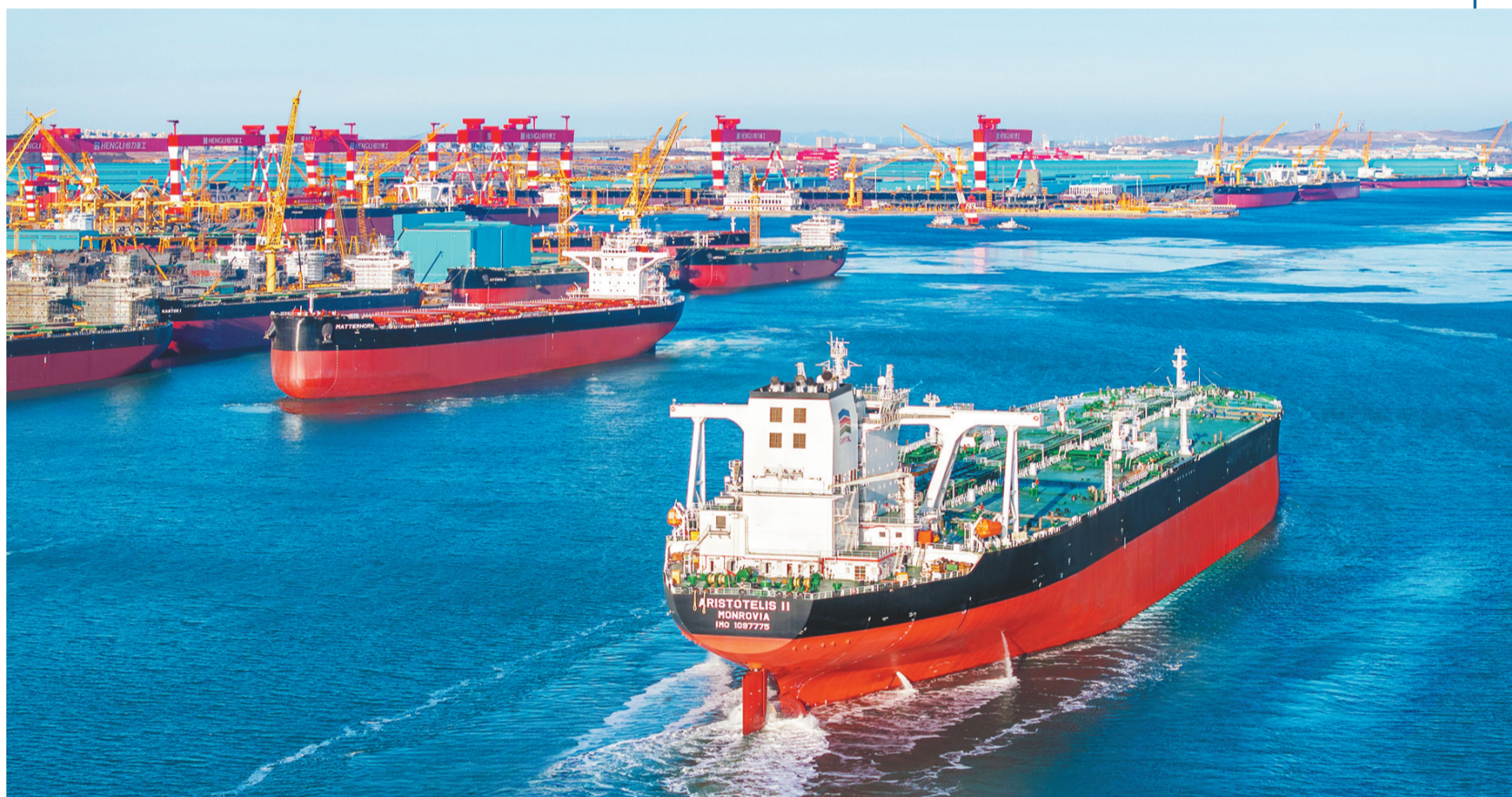
恒力重工超大型油轮试航。