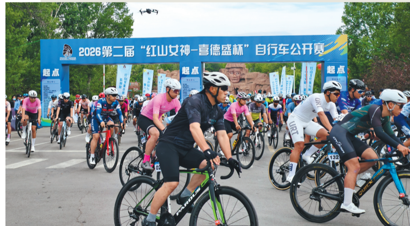
500多名来自全国各地的骑行爱好者齐聚建平，于青山绿水间竞技。