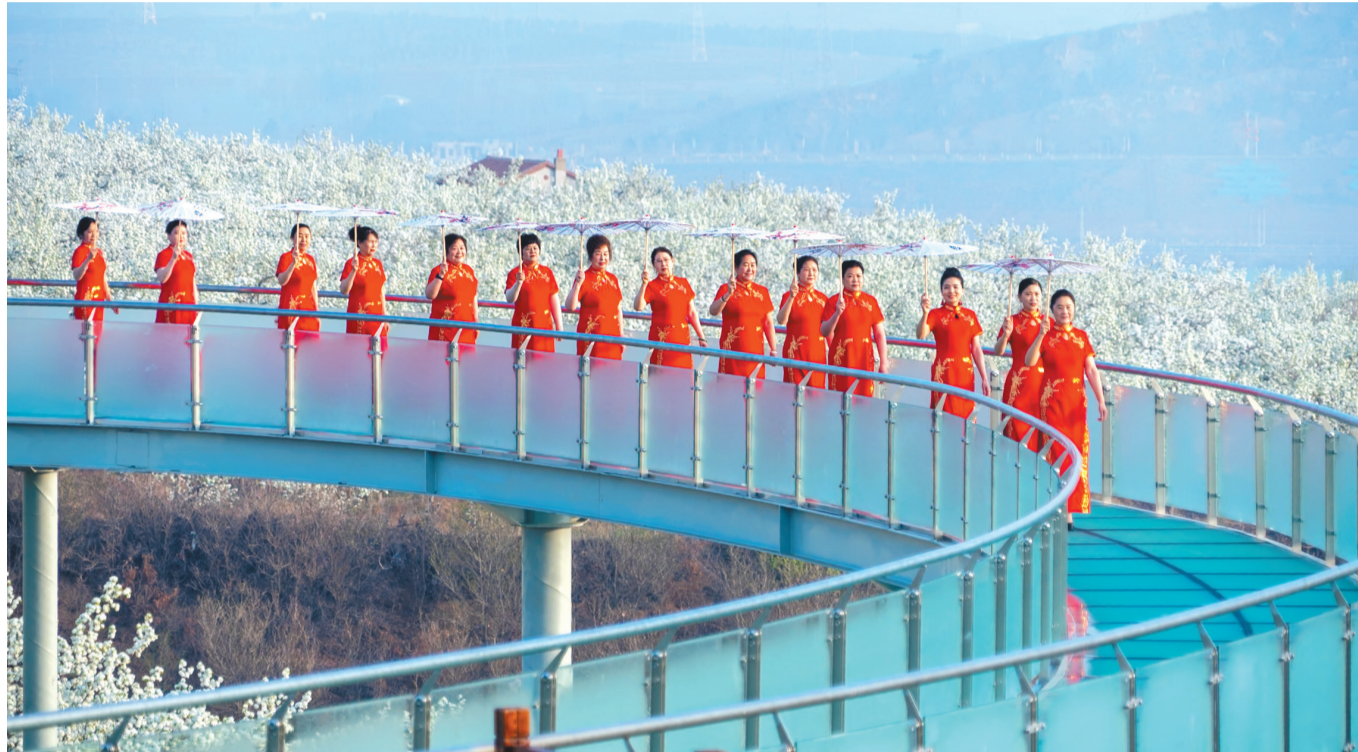
建平县老年模特队在梨花丛中展示优美身姿。