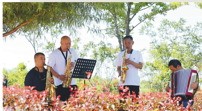
建平市民在公园花海里边赏花边娱乐。