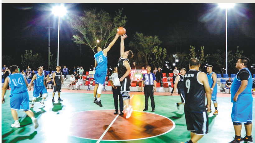
建平县小平房村的“村BA”篮球赛正激烈进行。