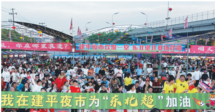
建平市民相聚“第二现场”，为“东北超”加油助威。

久，在小平房村，充满乡土气息的“村BA”篮球赛精彩上演。赛场上，本土代表队的球员们带球突破、精准传球、跃起投篮，动作行云流水；场边，不仅本村老少围坐四周，周边乡镇的村民甚至县城居民也专程驱车赶来观赛。加油声、呐喊声此起彼伏，赛场外还自发摆起了特色小吃摊、农特产品展销点，烤串、本村产啤酒、土鸡蛋等乡土好物借着球赛的热闹被一扫而空。