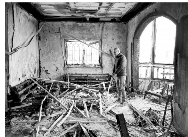
图为在约旦河西岸北部城市纳布卢斯，一名巴勒斯坦人查看被以色列定居者破坏的建筑。

巴勒斯坦约旦河西岸一条交通要道旁的麦田6月2日上午突然燃起大火。火焰在干燥的田野上迅速蔓延，田间噼啪作响，热浪逼人，升起的浓烟在数公里外都能看见。