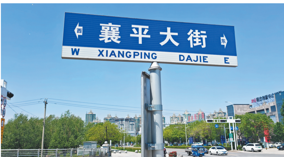
辽阳襄平大街路牌。

从战国时期市井流通的钱币，到如今遍布全城的文化印记，襄平布的蝶变，正是辽阳活本土历史文化血脉的生动写照。