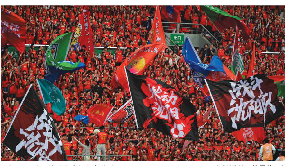
5月23日，沈阳铁西体育场气氛热烈。