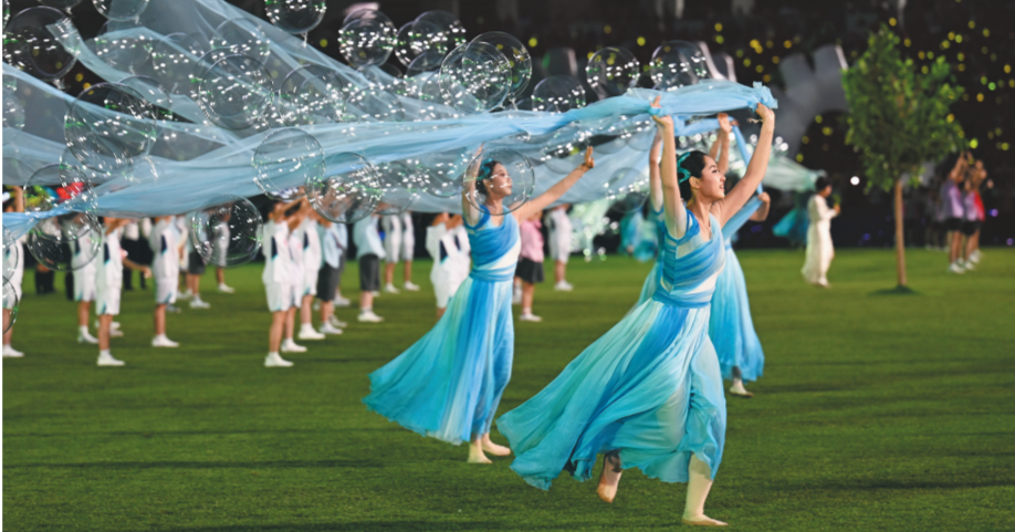
沈阳赛区开幕式上的精彩表演。