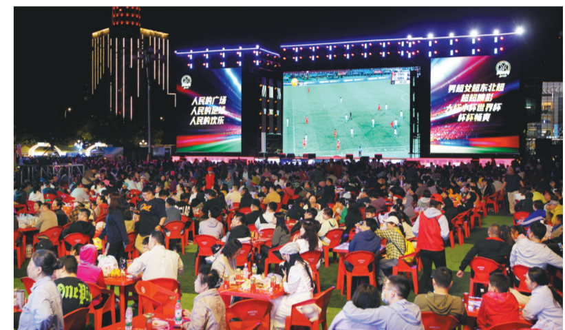
作为第二现场，沈阳人民广场吸引了大量市民。

本报讯 记者王琦 见习记者方子圆报道 为迎接“东北超”赛事，省商务厅全力推进第二现场打造，票根经济激活等促消费工作。目前，全省已布局800余个第二现场，覆盖商业综合体、酒吧餐饮、街区夜市、洗浴温泉、城市广场等多元场景，“泡澡看球、撸串看球、逛街看球、夜市看球”正在成为球迷观赛的新风尚。 在沈阳，城市地标人民广场变身开放式“城市观赛站”，巨幅屏幕、球迷打卡墙、特色美食市集一应俱全，市民边逛边看，足球激情融入城市烟火。朝阳市则分两批次陆续推出第二现场，观赛点位不断丰富，从商圈广场到特色街区，数量与质量同步提升。 全省各地大型商业综合体也积极响应，纷纷开辟专属观赛区域，同步推出“观赛+购物”优惠活动；凭球票或现场打卡可享餐饮折扣、满额赠礼、球迷套餐等实惠。锦州在重点商圈设立观赛展销区，抚顺举行麻辣烫