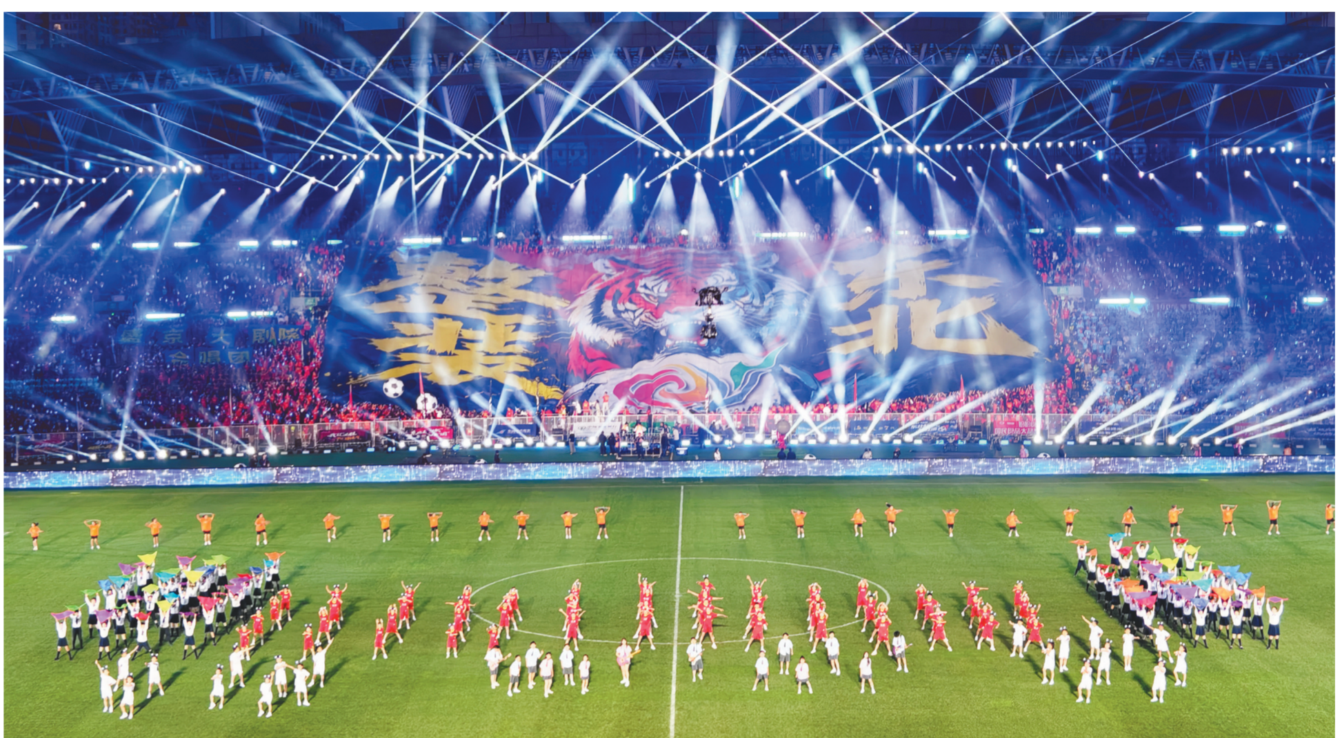
“东北超”沈阳赛区开幕式盛况。