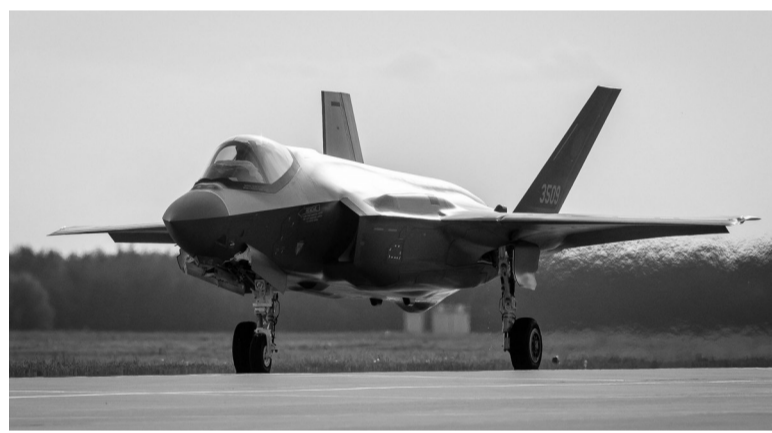
5月22日,在波兰瓦斯卡一处空军基地,一架F-35战机在跑道上滑行。

波兰副总理兼国防部长卡梅什22日在社交媒体上宣布,三架F-35战机已抵达波兰,这是首批正式驻扎在北约东翼的第五代战机。他表示,波兰正在考虑美国总统特朗普21日宣布的向波兰增派5000名士兵的决定。他说,波兰现在的目标是增加长期驻军,提升美军在波兰行动及与波兰军队协同作战的能力,以保障北约东翼安全。