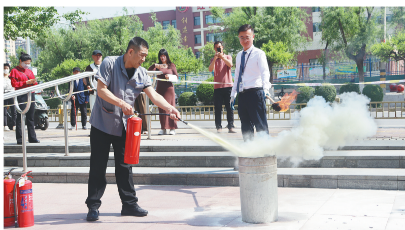
在朝阳双塔万达广场，工作人员学习使用灭火装备。

5月以来，双塔区组织领导干部深入基层一线，精准研判分管领域和包保地区安全生产实际，组织安全基础不同层级的企业分类开展实战演练，确保演练贴近实战，覆盖全面。双塔区应急局、文化旅游和广播电视局、民政局、消防救援大队、商务局等18个重点部门按职责督促分管企业完善应急救援预案，全面启动实战演练。各乡镇街道结合各自实际，联合行业监管部门组织辖区企业开展应急预案演练活动，形成“区级领导包保、部门联动指导、乡镇街道具体落实”的三级联动工作格局。