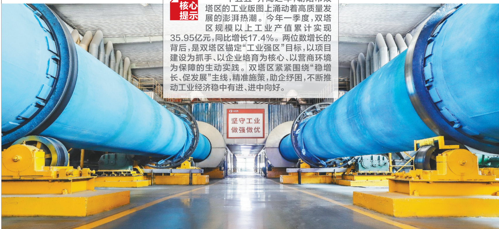
朝阳金达铝业有限责任公司生产车间焙烧机器有序运转。