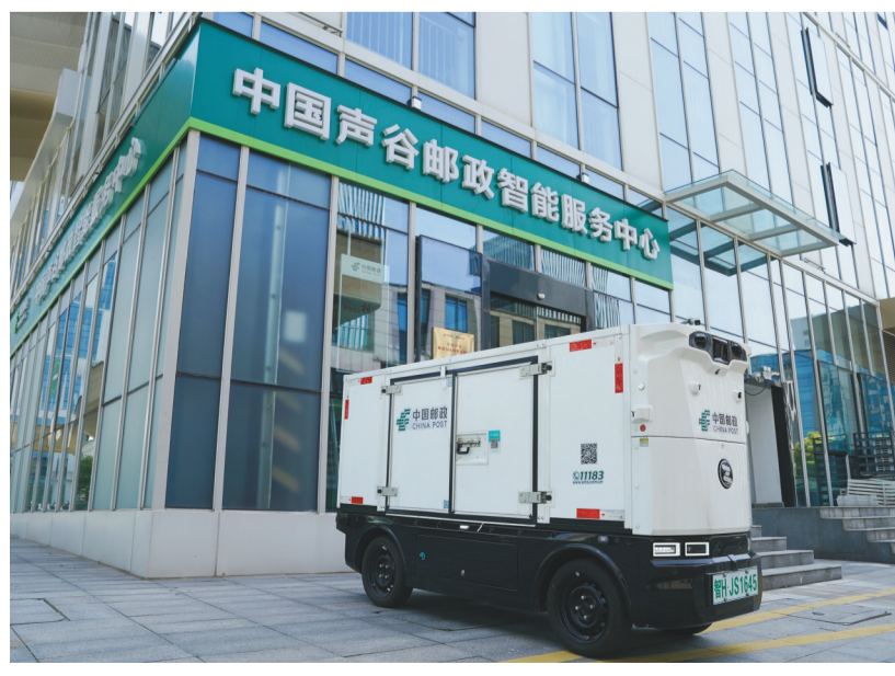
邮政无人车抵达安徽省合肥市中国声谷邮政智能服务中心。

核心提示 生产性服务业是推动经济增长、产业升级的关键力量。相关部门和地方正在协同发力全链条补强生产性服务业薄弱环节，为加快建设现代化产业体系提供有力支撑。 近年来，我国生产性服务业发展势头强劲，产业规模持续扩大，同时仍存在一些发展短板。目前，我国单位制造业产品总投入中的生产性服务业占比不足13%，而发达经济体普遍在20%左右，生产性服务业赋能制造业转型升级仍有较大空间。