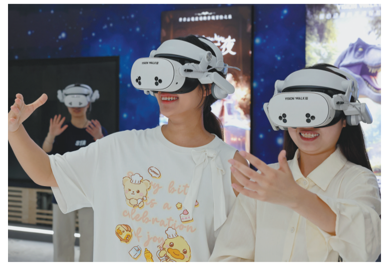
2026年国际博物馆日即将到来，各地迎来博物馆参观游览热潮。图为5月17日，在山东省枣庄市博物馆，参观者戴着VR眼镜体验考古场景。