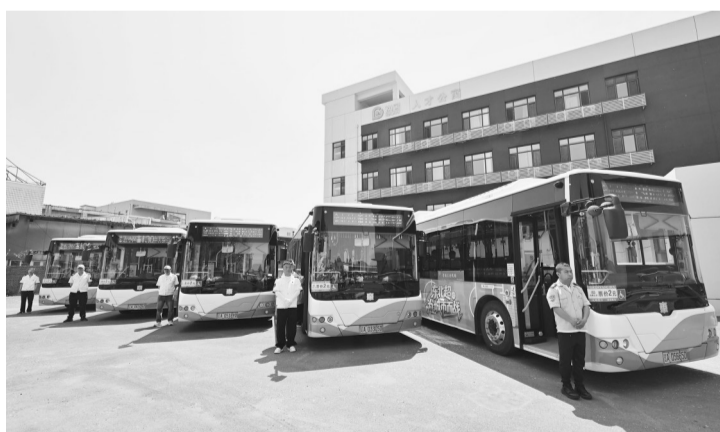
左图：主题公交内“东北超”氛围拉满。右图：“东北超”主题公交整装待发。

本报讯 记者陶阳报道 “发车！”5月14日上午11时许，随着站务人员一声令下，“东北超”主题公交从沈阳金山停车楼公交站缓缓驶出，正式上线运营。平日服务通勤市民的130路公交车，成了穿行城市的流动风景线、欣赏城市风光的旅游线。 “‘东北超’在家门口举办，咱打心底骄傲！”作为主题公交首发驾驶员，田野满心欢喜，一早就把车厢扫了又扫，把车身擦得锃亮。他说：“欢迎东北三省一区的兄弟，咱一定用周到服务让大家感受咱沈阳人的热情。” “‘东北超’，为城市而战！”“我在沈阳很想你”……“东北超”主题公交由沈阳市城投集团与沈阳市文体旅集团联合打造，车身绘有醒目“东北超”赛事标识，车厢内满是足球文化元素、文旅主题装饰，氛围感直接拉满。 沈阳市民孟樱潭经常乘坐130路公交车上下班，周末还搭车去北陵公园遛弯，对130路再熟悉不过。这次，她离老远就发现了“不对劲”，一上车就沉溺到赛事氛围里，她说：“一上车就有了仪式感，好像到了‘东北超’现场。” “东北超”主题公交线路途经北陵公园、青年大街、新市府等沈阳核心节点，串联一河两岸的底蕴与繁华。行驶过程中，车内高频次播报“东北超”赛事与城市信息，将足球文化和城市空间深度融合，方便游客市民更直观地了解赛事，参与盛会。 特朗普抵达时，礼兵列队致敬。两国元首登上检阅台，军乐团奏中美两国国歌，天安门广场鸣放礼炮21响。特朗普在习近平陪同下检阅中国人民解放军仪仗队，并观看分列式。 蔡奇、王毅、何立峰参加会谈。