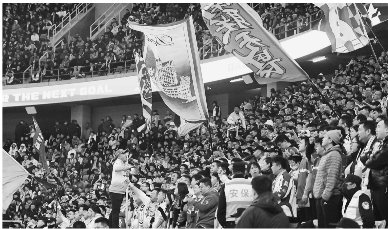
大连球迷用激情呐喊为家乡球队赋能。

两连败后球票依然迅速售罄,反映了大连人对足球的热爱程度。在梭鱼湾足球场,当全场整齐地竖起蓝色